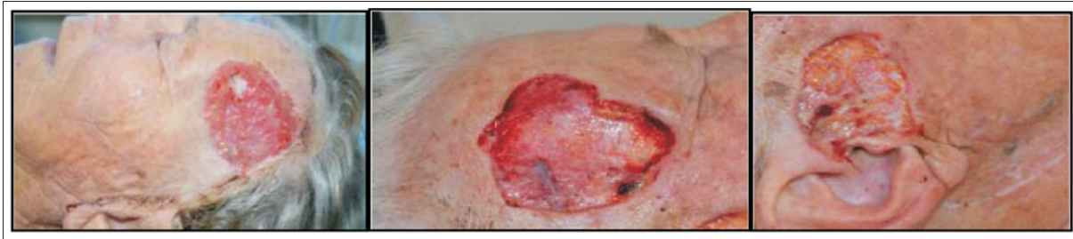
Figura 3. Cierre por segunda intención, a un mes del posoperatorio.