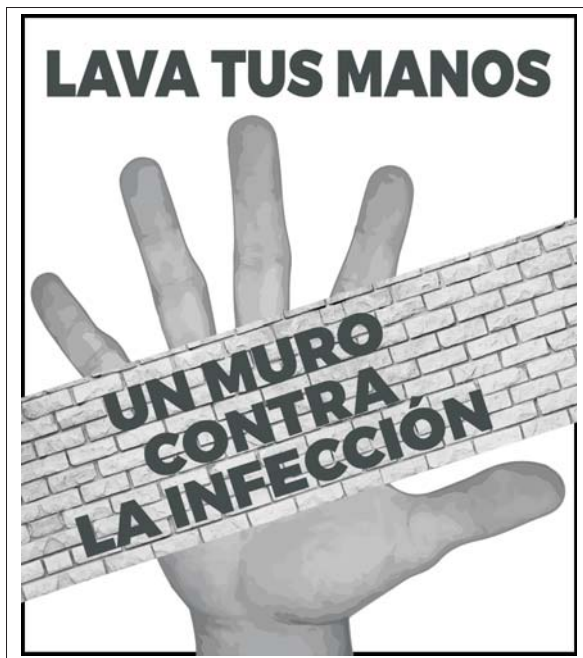
Figura 1. Importancia del lavado de manos.

percusión del empleo de antibióticos tiene mayor trascendencia: es responsabilidad de los comités de infección la implementación de enérgicas medidas de prevención y control, ya que son frecuentes los brotes intranosocomiales por bacterias multirresistentes de difícil y oneroso manejo terapéutico. También el empleo de las vacunas disponibles contribuirá a reducir las enfermedades infecciosas, que además de prevenir esas enfermedades en los vacunados, según la etiología, pueden reducir la diseminación de bacterias, protegiendo indirectamente a la población no vacunada (24) .