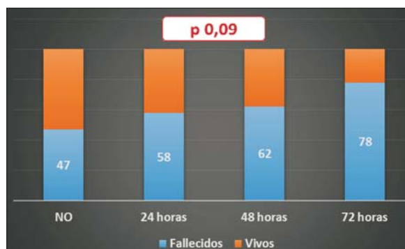
Figura 3. Mortalidad (%) en UCI según presencia y tiempo de instalación de criterios de activación

Durante el período de estudio, el 13% de los pacientes ingresados a UCI procedían de sala general teniendo como causa de ingreso un deterioro de su situación clínica. El motivo de ingreso fue en su mayoría insuficiencia respiratoria y sepsis (22% y 20,3%), seguido por causas neurológicas y shock principalmente (figura 1). Estos pacientes presentaban una estadía hospitalaria previo al ingreso a UCI prolongada, con una media \pm