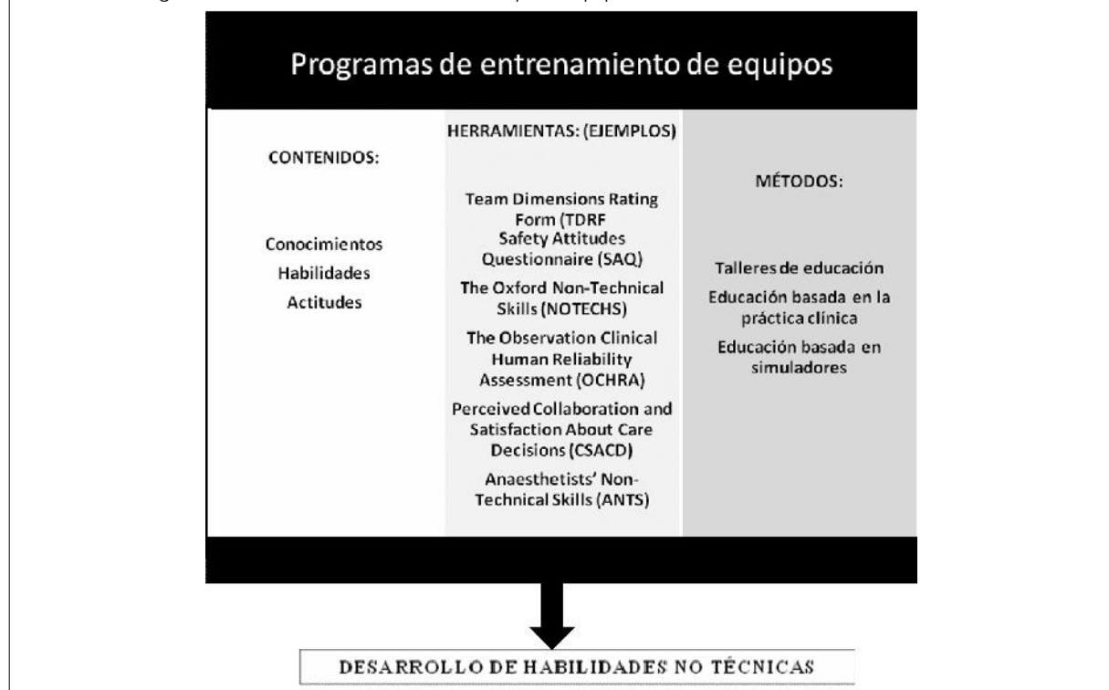
Tabla 1. Estrategias institucionales de entrenamiento para equipos médicos.

mientos, habilidades y actitudes más que en la permanencia de ejercicio diario en el mismo lugar físico. Los programas de entrenamiento de equipos no incluyen el desarrollo de las habilidades académicas de las especialidades médicas. La instrucción para los equipos se basa en tres pilares: contenidos, herramientas y métodos, que en su conjunto forman una estrategia institucional de instrucción. Los contenidos incluyen conocimientos, habilidades y actitudes que favorecen el desarrollo de las competencias necesarias para el trabajo grupal. Las herramientas son necesarias, por un lado, para realizar el análisis de las tareas del equipo, y, por otro, para medir los logros en cuanto al desempeño del trabajo grupal. Algunos ejemplos de herramientas desarrolladas para medir las competencias de los equipos son las siguientes: Team Dimensions Rating Form (TDRF), Safety Attitudes Questionnaire (SAQ), Anaesthetists' Non-Technical Skills (ANTS) (tabla 1). Los métodos pueden ser talleres de educación, educación basada en la práctica, clases magistrales y se utilizan para transmitir los contenidos e implementar las herramientas de evaluación (tabla 1).