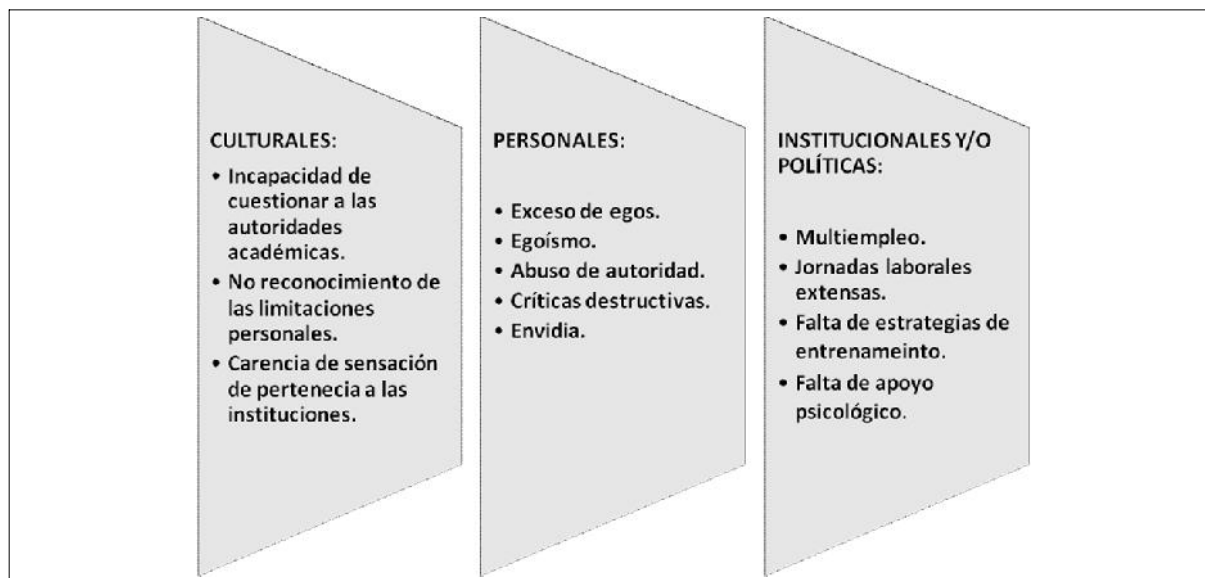
Figura 2. Comportamientos disruptivos y dificultades para la implementación del trabajo en equipo.

psicólogos y profesionales expertos, entrenados en entrenar equipos.