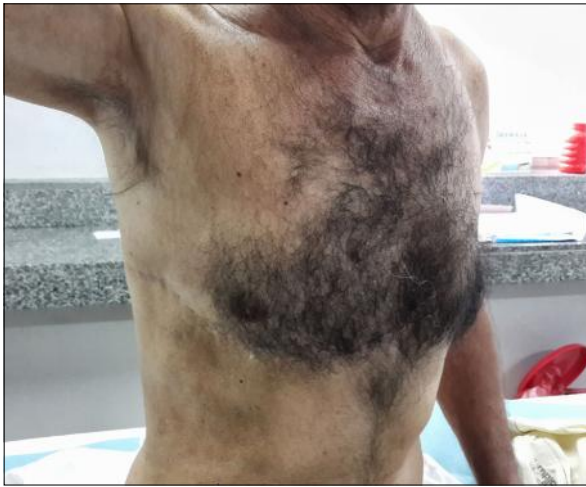
Figura 5. Imagen del paciente al año de la cirugía, se evidencia el buen resultado mecánico y cosmético, sin recidivas locales.

sintéticos, siendo estos últimos los más utilizados. Los más usados históricamente son resina acrílica, silicona, polietileno, polipropileno (malla de Marlex® o Prolene®) y politetrafluoroetileno (Gore-Tex®) (2,10) . Además, existen costillas de acrílico, desarrolladas por Crosa en nuestro país, que pueden ser usadas para este fin.