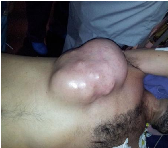
Figura 1. Paciente en decúbito lateral izquierdo donde se muestra la voluminosa tumoración de la pared torácica.