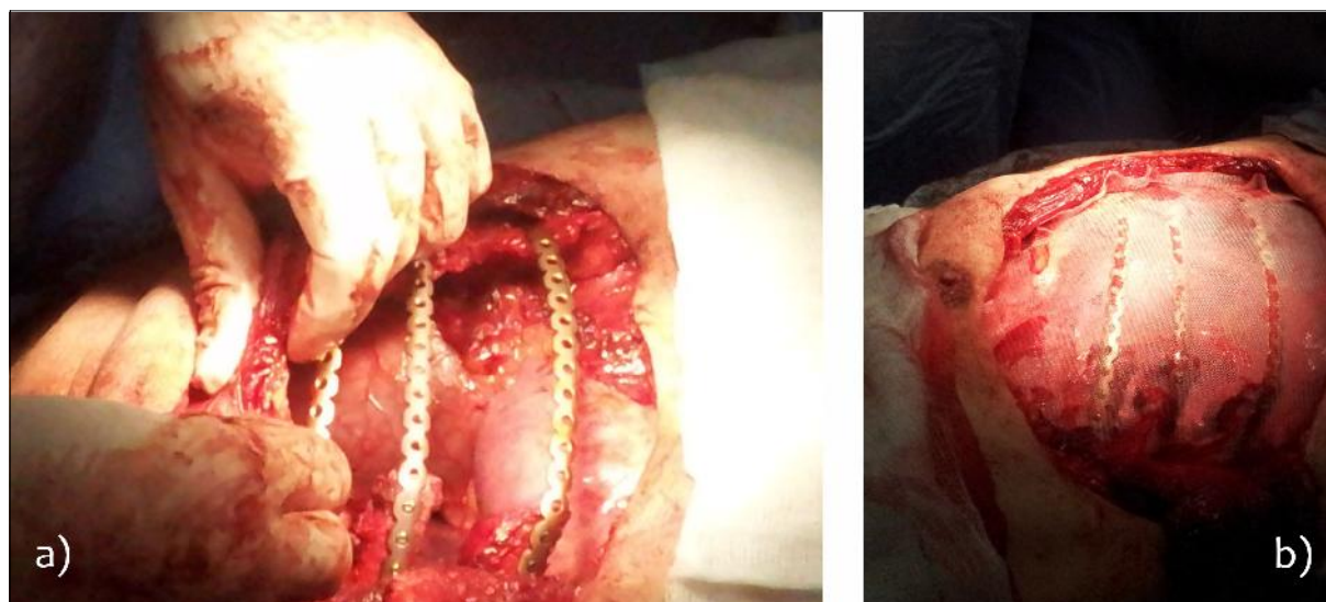
Figura 3. a) La resección se completó y se colocan las prótesis de titanio al sector de parrilla costal remanente. b) La misma se cubre con una malla de polipropileno a tensión para mantener la forma de la pared torácica, evitando la herniación del pulmón subyacente.

Al año de la cirugía el paciente se encuentra asintomático, sin dolor ni limitación funcional, con un satisfactorio resultado cosmético (figura 5). Se realizó espirometría de control presentando un VEF1 de 87% y una tomografía computada de tórax que no evidencia recidiva local ni a distancia.