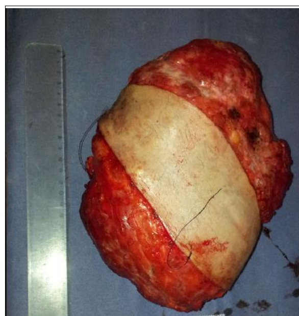
Figura 4. Pieza de anatomía patológica de 19 por 18 por 10,5 cm, con un área total de 268 cm 2 , cuyo resultado definitivo correspondió a sarcoma de bajo grado.

De las series más grandes de resección de tumores de pared torácica, Weyant y colaboradores (3) reportan una mortalidad de 3,8% y hasta un 3% de falla respiratoria, con un área media de resección de 80 cm 2 y una media de tres costillas (1,2,4,7) . La reconstrucción debe ser realizada