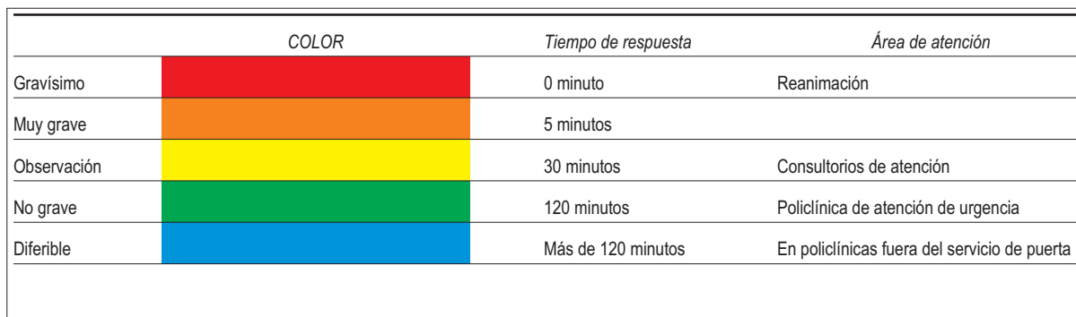
Triaje en el Hospital de Clínicas.