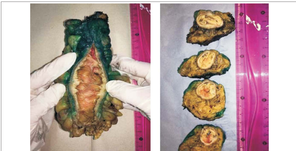
Figura 1. Macroscopía.

Un elemento que recientemente ha vuelto a ser considerado como un importante factor pronóstico es el denominado tumor budding , definido como la presencia de células tumorales aisladas o en pequeños grupos de más de cinco células situadas en el frente infiltrante del tumor (26) . Cuando este se encuentra en alto grado, se asocia a otros factores de mal pronóstico como son mayor profundidad de invasión, metástasis ganglionares e invasión perineural (27) . De acuerdo a las últimas recomendaciones del Colegio Americano de Patólogos (28) , este