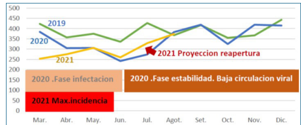
Figura 1. Evolución global de la producción quirúrgica del HM en 2019, 2020 y primer semestre de 2021.

La fuente de datos es el programa informático GDQ/ASSE (Sistema de Gestión de Demanda Quirúrgica) que consiste en un registro nacional único que contiene los usuarios del sistema público de salud (ASSE) que esperan ser intervenidos quirúrgicamente. Los datos de recursos humanos fueron otorgados por el Departamento de personal del HM.