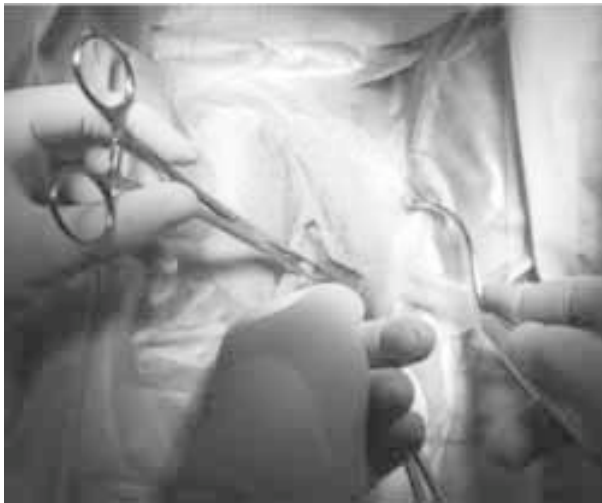
Figura 5. Técnica quirúrgica. Pasaje de la aguja

tensión hasta el punto en que con maniobras de Valsalva excesivas (tos fuerte) no se manifieste la incontinencia urinaria. Se recomienda que sólo aparezca el brillo de la gota de suero en el meato uretral ya que al recuperar la posición ortostática y al descender la pared anterior de la vagina, la angulación sobre la uretra actúa como un mecanismo de continencia urinaria.