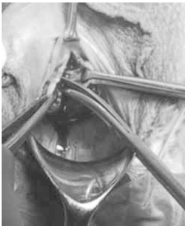
Figura 3. Técnica quirúrgica: disección subvaginal

Dando apoyo externo sobre la vagina con el pulpejo del dedo índice homolateral a la incisión se disecciona con tijera dirigiendo la punta de la misma hacia la cara profunda de la rama isquiopubiana hasta tomar contacto con el periosteo (figura 3). Una vez logrado esto, se amplía la prolongación anterior de la fosa isquioanal mediante la