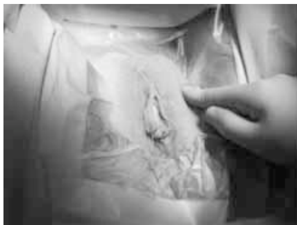
Figura 4. Técnica quirúrgica. Topografía del emplazamiento de la incisión inguinocrural