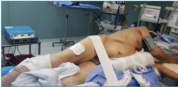
Figura 1. Posición del paciente