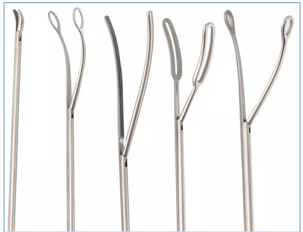
Figura 4. Se utilizan instrumentos curvos. Esto permite poder visualizar la punta del mismo en todo momento, lo que da mayor seguridad en las maniobras.

En casi todos los casos usamos algún instrumento de energía, en general un bisturí ultrasónico de 23 cm de largo, ya que no interfiere con el cuerpo de la cámara (HARMONIC Shears® 23 cm, Ethicon, Johnson & Johnson Medical Devices). Las máquinas de sutura mecánica son anguladas, lo que facilita su pasaje y la orientación adecuada en el momento de su aplicación.