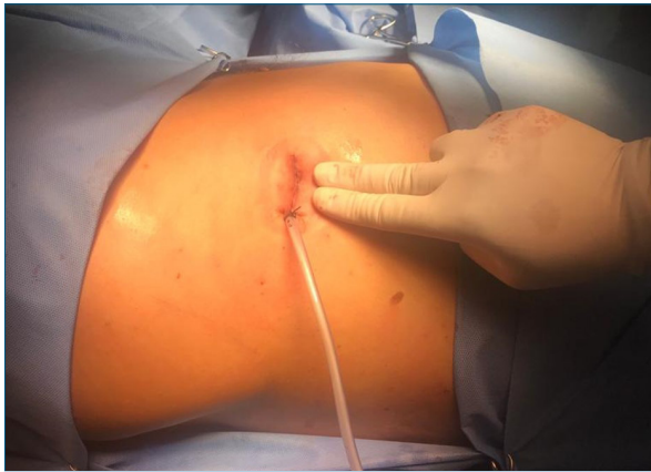
Figura 5. Final de la cirugía. Se evidencia el tamaño de la incisión así como la salida del drenaje a través de la misma.

resto de los pacientes fueron sometidos por otras causas a cirugía uniportal (tabla 3).