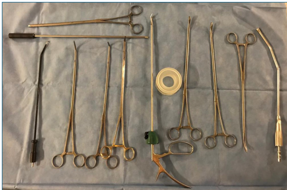
Figura 3. Instrumentos utilizados en cirugía uniportal en nuestro hospital. Todos son doblemente articulados para permitir su máxima apertura.