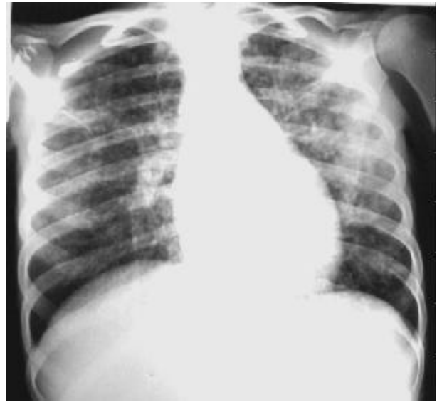
Figura 1. Radiografía de tórax mostrando un infiltrado intersticio-nodular bilateral, con predominio en pulmón izquierdo

La strongiloidiasis se diagnostica con mayor frecuencia en el norte del país, particularmente en áreas de los departamentos de Rivera y Tacuarembó, donde las condiciones climáticas y de los terrenos son más propicias para el desarrollo de la vida libre del parásito. Es posible encontrarla en otras partes del país e incluso existe la fuerte presunción de focos autóctonos en Montevideo. La frecuencia de las geohelminCIAS en general, particularmente de la ascariasis y tricocefalosis, actualmente muestra un destacado aumento en Montevideo, área metropolitana, y en otras zonas del país, ligada a la expansión incontrolada de asentamientos humanos con graves carencias sociales hacia zonas sin saneamiento y con ambientes favorecedores de la transmisión (3,4) .