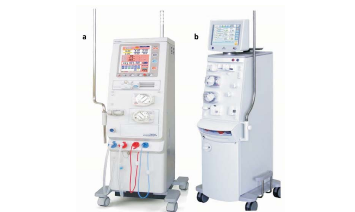
Figura 3. Monitores para HDF-OL: (a) Toray 8000®, (b) Nipro NCU-18®.

KoA (coeficiente que mide porosidad y espesor de la membrana) de urea > 600 y un KoA de beta2-microglobulina > 60 , y un área de superficie elevada de entre 1,5 y 2,1 m^2 . Se definió desde el inicio la no reutilización de las fibras para minimizar al extremo el riesgo infeccioso.