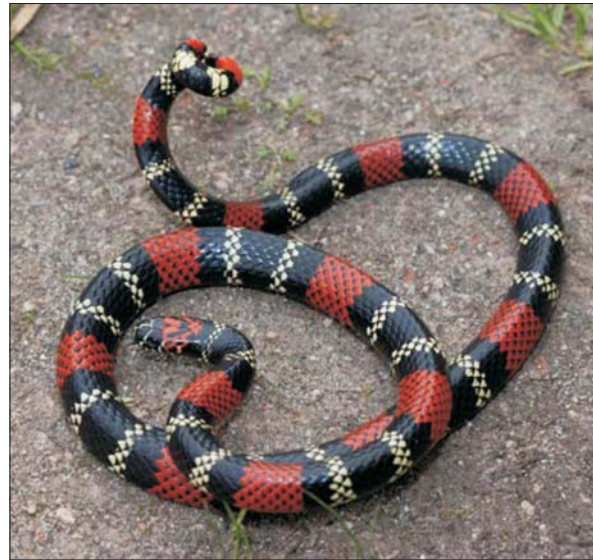
Figura 1. Ejemplar adulto de Micrurus altirostris . Presenta anillos completos alrededor del cuerpo, negros agrupados de a tres, separados por anillos amarillos (tríadas) y entre estos se encuentra un anillo rojo.

Hombre de 25 años, procedente de zona rural de Florida, sin antecedentes a destacar, mordido en el tercer dedo de mano izquierda al manipular durante horas a un ofidio que describe con anillos negros, rojos y amarillos. Comienza con dolor abdominal y náuseas, agregando aproximadamente a las cinco horas del accidente mareos, visión borrosa y diplopía, por lo que consulta en emergencia del Hospital de Florida. Al ingreso refiere mialgias, disfagia y dolor en sitio de mordedura. Al examen físico se observa una puntura no sangrante, con eritema y edema leve localizado en tercer dedo de mano izquierda sin equimosis (figura 2). Lúcido, con disartria, oculomotricidad sin alteraciones. Reflejo fotomotor y consensual conservados. Se consulta al CIAT, realizándose evaluación fotográfica del ofidio identificán-