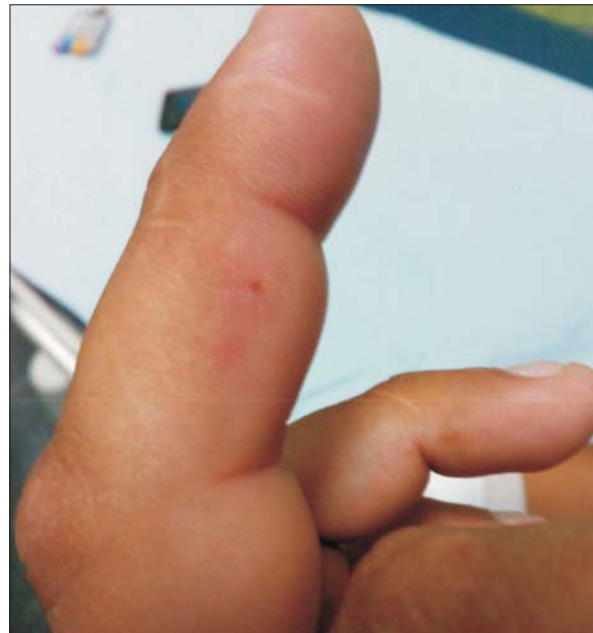
Figura 2. Puntura no sangrante, eritema y edema leve localizado en tercer dedo de mano izquierda sin equimosis.

dose el ejemplar como víbora de coral ( M. altirostris ) (figura 3). Ingres a la Unidad de Tratamiento Intensivo (UTI) dada la progresión de síntomas, agregando ptosis palpebral bilateral y parálisis flácida de miembros (aproximadamente a las siete horas de evolución). Peo-