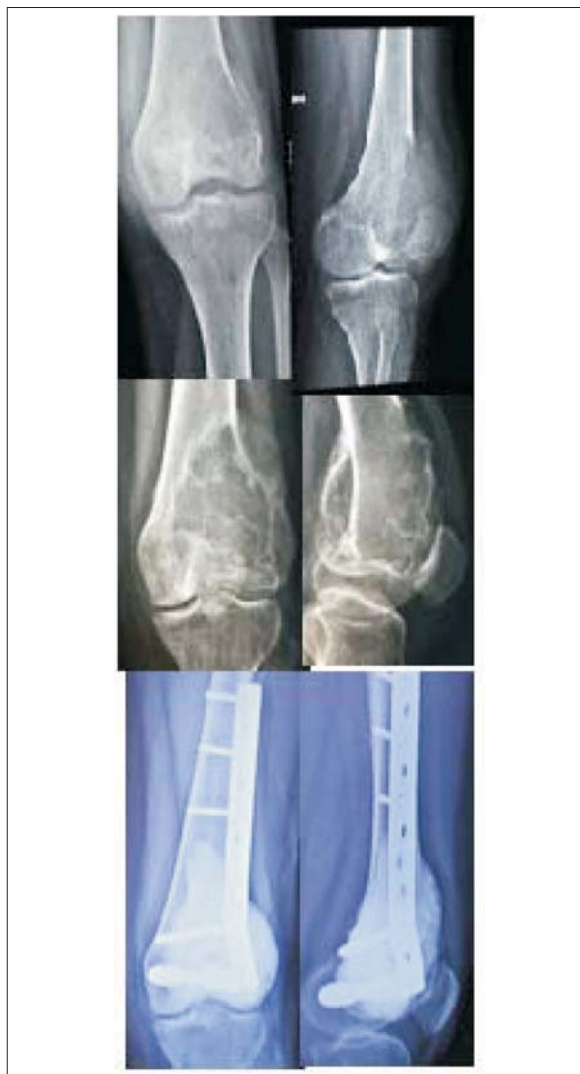
Figura 2. Arriba: lesión antes del tratamiento y evolución preoperatoria. Abajo: después de la cirugía plantada luego del tratamiento con denosumab.

En cuanto a la imagenología se constató una esclerosis y disminución marcada de la lesión, lo que permitió en uno de los pacientes realizar una resección intralesional y en el otro completar el tratamiento sin una resección quirúrgica. Estas diferencias terapéuticas encontradas en nuestros pacientes, entre el planteo inicial y el