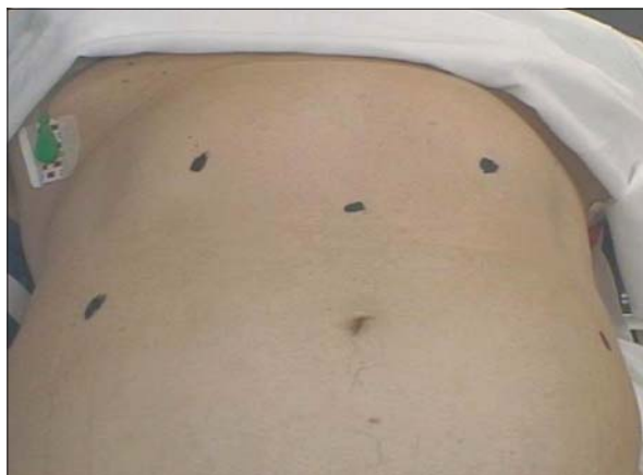
Figura 2. Topografía de colocación de los trócares (en M)